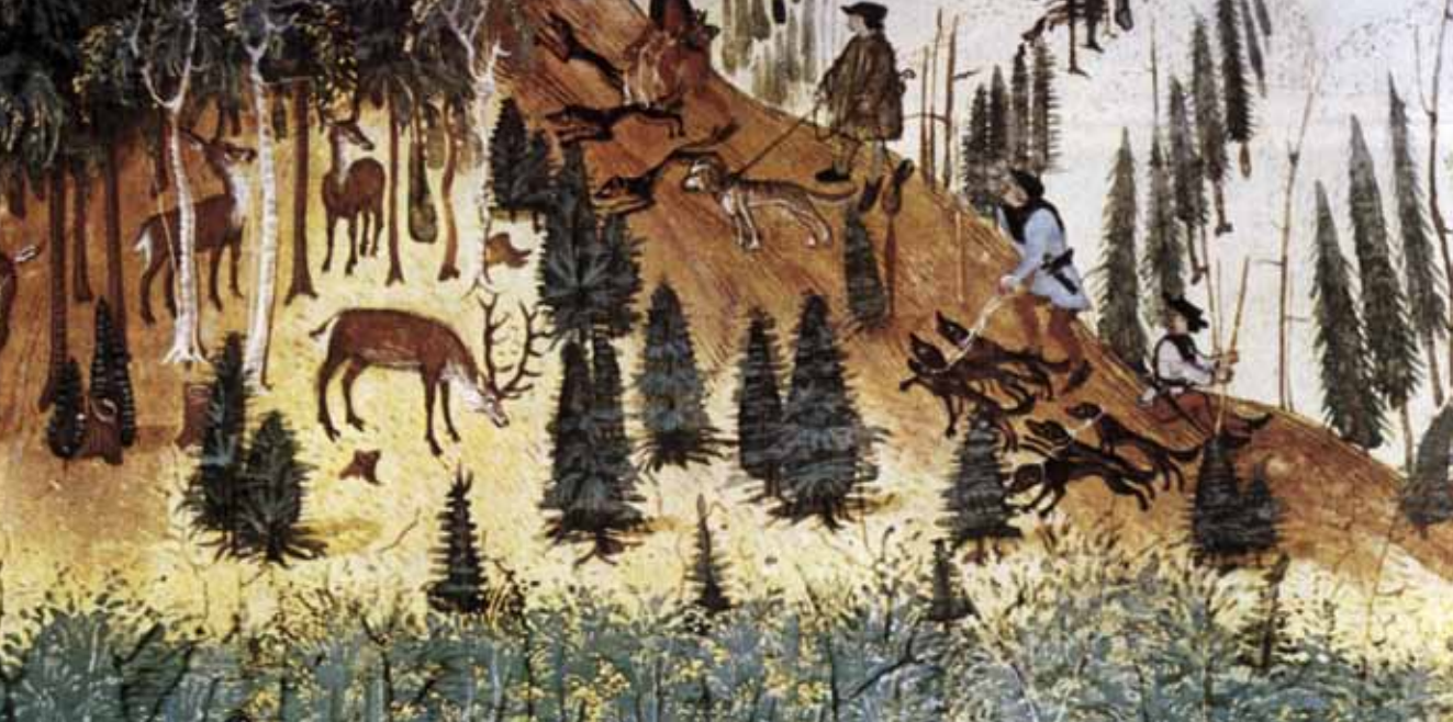
Rakúsky maliar zo 16. storočia: Poľovačka cisára Maximilána I. Iluminácia z knihy O love a rybárstve. Unknown Austrian painter from 16 th century. Emperor Maximilian I hunting. Illumination from the book On Hunting and Fishing.